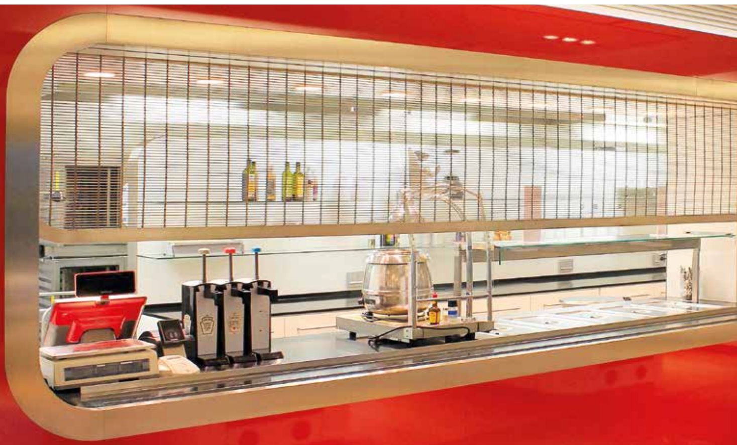
Rollabschluss in einer Kantine, Münster, Architekt: Vervoorts & Schindler Architekten BDA, Bochum, Gewebe: Tigris

Ausführung eignen sich die Systeme für den Außen- oder Innenbereich. Durch das transparente Erscheinungsbild lassen unsere GKD-Metallgewebe weiterhin den Blick auf die dahinter liegenden Bereiche zu und engen somit den räumlichen Gesamteindruck nicht ein. Ein darauf abgestimmtes Beleuchtungskonzept kann die transparente Ästhetik noch zusätzlich betonen. Der Transparenzgrad ist dabei individuell über die Dichte des Gewebes bestimmbar. Als Systemanbieter unterstützen wir unseren Kunden von der