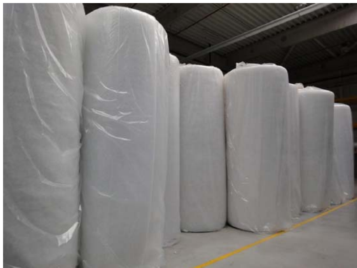
Bild 11-12: Blick in das Fertigwaren-Lager: Fertig gewickelte Rollen aus einem Rohmaterialballen