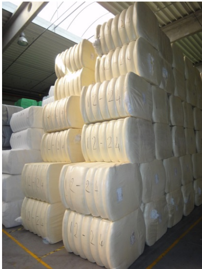
Bild 1: Faserballen im ungarischen Rohmateriallager der J.H. Ziegler Magyarorszá Kft.