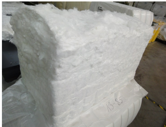
Bild 2: Rund 3.500 Tonnen Fasern werden bei Ziegler in Ungarn verarbeitet.