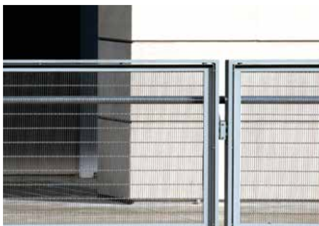
Titel + photo 4: The Art Institute of Chicago, Illinois, architecte : Renzo Piano, France, maille : Tigris PC, ©GKD/Apple Group