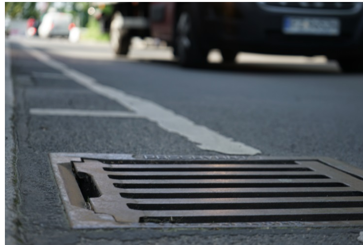
Bild 2: Der Probenahmekorb wird in Straßen-Gullys gehängt und ermöglicht dort die verlässliche Beprobung des Straßenablaufwassers.