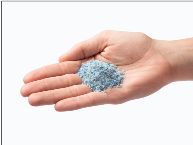
Bild 1: Mikroplastik – weniger als fünf Millimeter große Kunststoffpartikel – ist ein globales Umweltproblem.