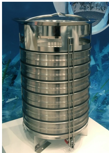
Bild 3-4: GKD entwickelte einen Probenahmekorb mit bis zu sechs Filterelementen und definierter Fraktionierung zur Beprobung eines gesamten Regenereignisses.