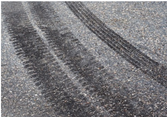
Bild 7: Jährlich fallen laut Umweltbundesamt bis 111.000 Tonnen Reifenabrieb allein in Deutschland an.