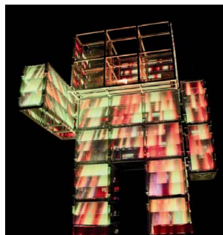
Bild 5: Nachts erwecken computergesteuerte Lichtinszenierungen den Indemann zum Leben.