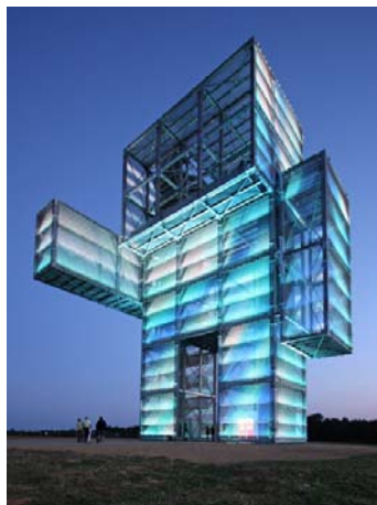
Bild 1-2: Der Indemann hat einen Merit Award der amerikanischen Society for Environmental Graphic Design (SEGD) gewonnen.