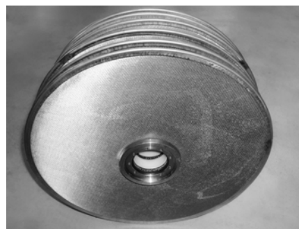
Bild 3: MAXFLOW-Filterpaket bestehend aus mehreren Filterscheiben.