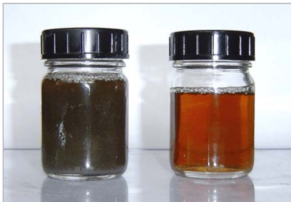
Bild 4: Verschmutztes Kühlschmieröl der Schleiferei (l.) und gereinigtes Kühlschmieröl nach der Filtration durch MAXFLOW (r.).

Das Bildmaterial darf ausschließlich für das hier genannte Thema der Firma GKD – GEBR. KUFFERATH AG verwendet werden. Jede darüber hinausgehende, insbesondere firmenfremde Nutzung wird ausdrücklich untersagt.