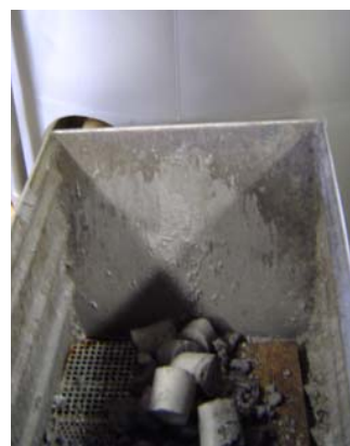
Bild 5: In der Brikettlore werden die gepressten Trockenbriketts gesammelt.