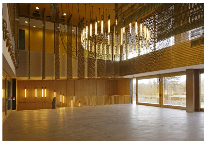
Photo 8 : Pour l'aménagement du Salon Présidentiel , Perrault a également misé sur des panneaux suspendus et des habillages muraux de grand format en maille métallique GKD de type ESCALE 7x1.

Photo 1, 2, 5, 7 © Dominique Perrault Architecte/ Adagp