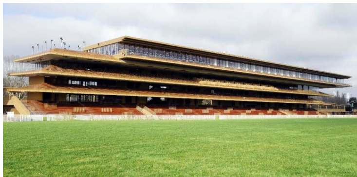
Photo 1 : La forme de la tribune principale rappelle un cheval de course au galop en raison des étages ouverts, légèrement décalés et doublement inclinés.