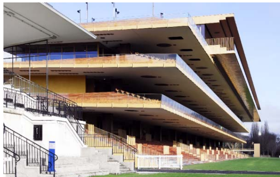
Photo 2 : La tribune, un bâtiment de quatre étages, qui se présente comme une superposition d'étagères, offre une vue panoramique de 360 degrés.