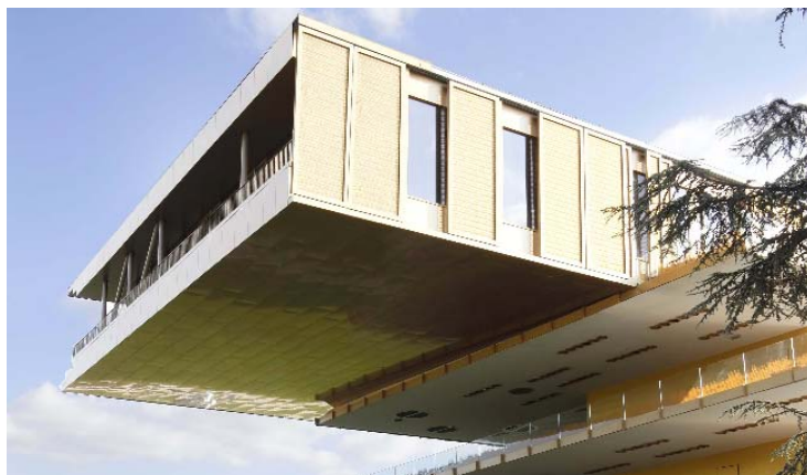
Photo 5 : Les panneaux de protection thermique en maille métallique GKD de type ESCALE 7x1,5, de plus de trois mètres de haut et 1,70 mètre de large, protègent le bâtiment d'un réchauffement indésirable.