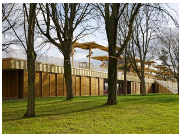
Photo 4 : La membrane scintillante de GKD dialogue avec l'environnement naturel.

Photo 1, 2, 5, 7 © Dominique Perrault Architecte/ Adagp