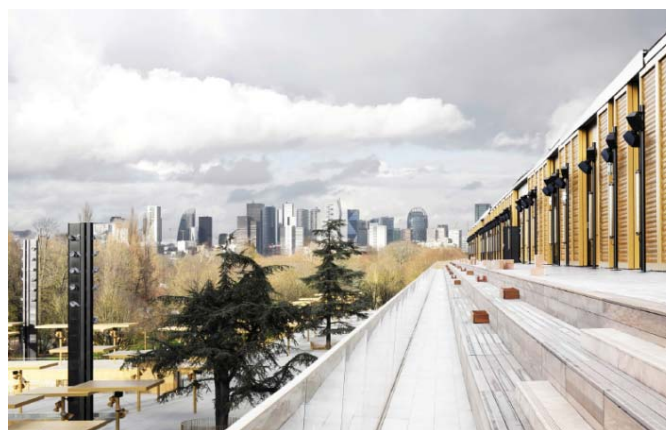
Photo 6 : Lors de la refonte du champ de courses de ParisLongchamp, Dominique Perrault a cette fois encore misé sur la maille métallique de GKD.