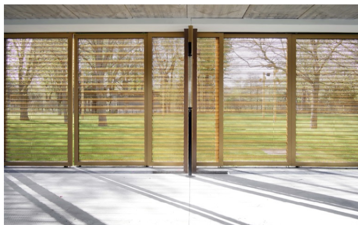
Photo 7 : Les panneaux de protection thermique en maille métallique GKD garantissent la transparence maximale expressément souhaitée.