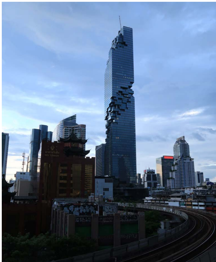
Photo 4: Derrière le Cube s'élève un immeuble de parking équipé d'un système de stationnement entièrement automatique, pouvant accueillir environ 900 voitures sur 10 400 mètres carrés.