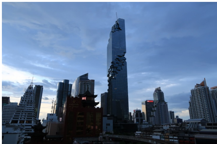
Photo 1: L'architecte allemand Ole Scheeren a créé avec le gratte-ciel MahaNakhon, haut de 314 mètres, le nouveau symbole de Bangkok.

Habillage d'un immeuble de parking en maille métallique – pendant discret du gratte-ciel emblématique