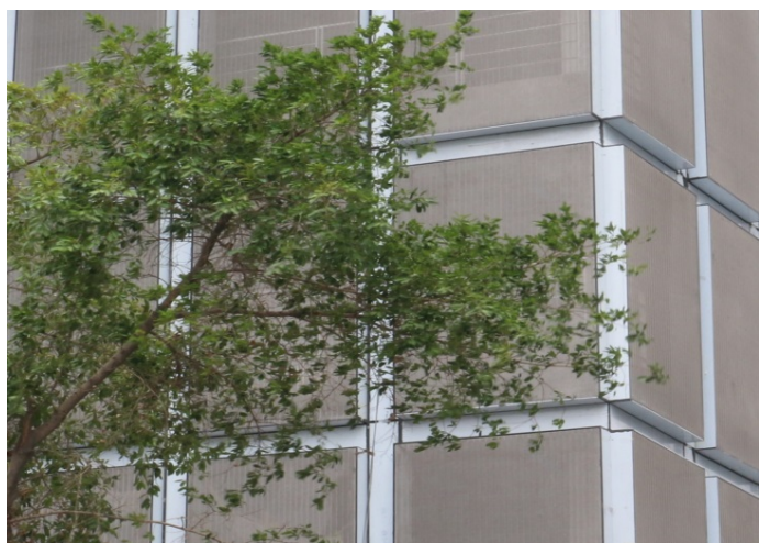
Photo 2: Pour harmoniser le parking visuellement avec l'ambiance générale de luxe, l'architecte a choisi pour l'habiller une maille inox scintillante de type PC-Sambesi de GKD.