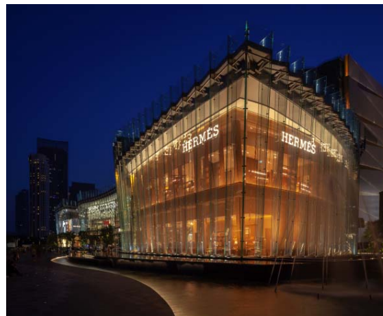
Bild 4: Eine im gleichen Winkel geneigte, durchgehende Innenfassade aus bronzen lackiertem Metallgewebe von GKD verleiht dem Hermès-Flagship-Store in Bangkok besonderen Glanz.

Bild 1 © GKD Bild 2-4 © GKD/Spaceshift Studio