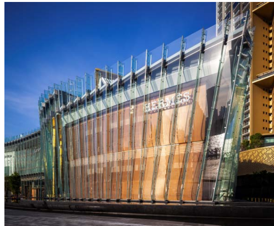
Bild 2: Die frei hängende Innenfassade aus Metallgewebe von GKD verbindet die beiden Store-Ebenen optisch miteinander und folgt wie ein Vorhang der dynamischen Linienführung der Fassade.