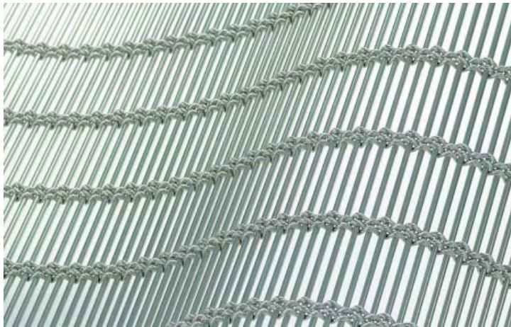
Bild 1: 815 Quadratmeter Edeltstahlgewebe vom Typ Sambesi von GKD kamen für die Innenfassade des Hermès-Stores zum Einsatz.